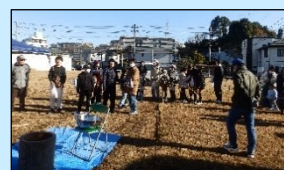
もちつきの順番待ち。