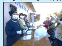
あんこときな粉のおもちが 販売されました。