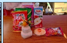
子どもたちに 配布されたミニ 鏡餅とお菓子