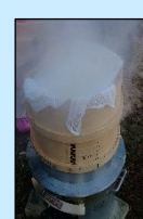
せいろで蒸し たてのもち あつあつ